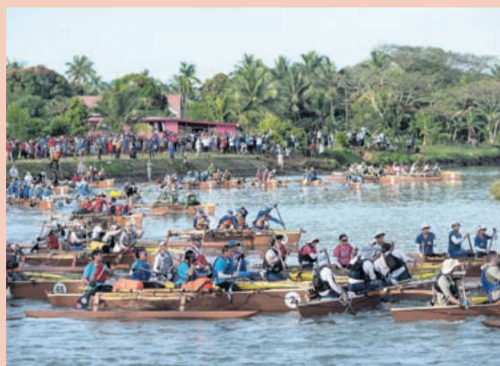
In this image released by Amazon, racers compete in the 2019 Eco-Challenge adventure race in Fiji.